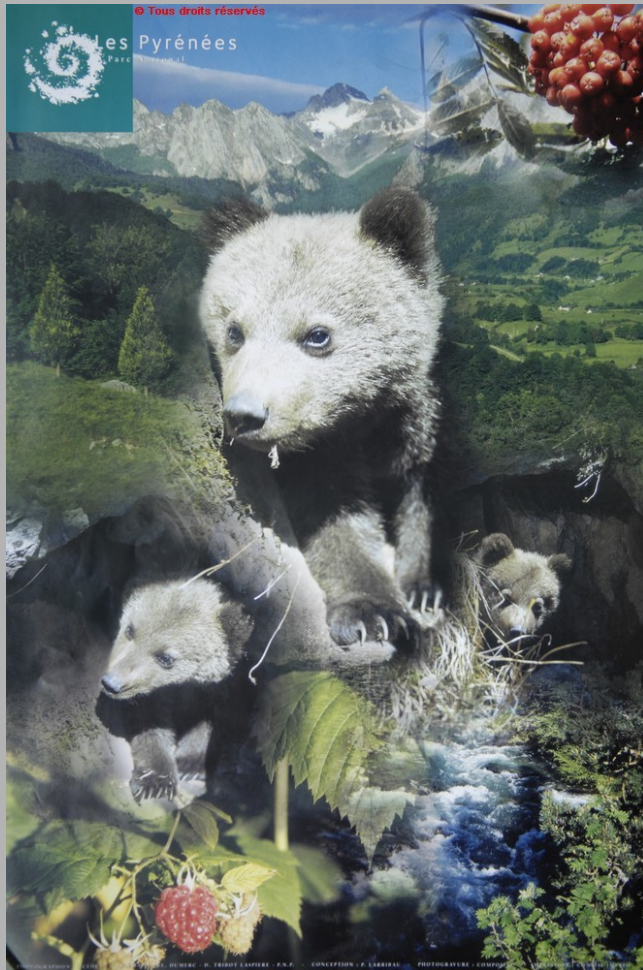
Parc national des Pyrénées, affiche, 1996