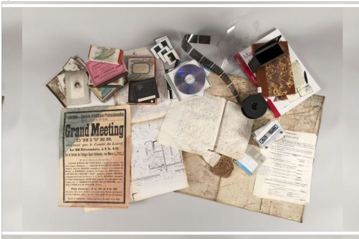
Photographie - sources ; Archives départementales du Loiret