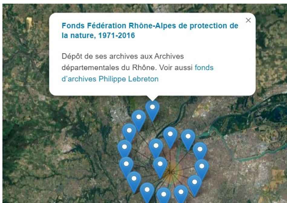
Géolocalisation des fonds d'archives concernant le département du Rhône

https://ressources.histoire-environnement.org/Carte?filtre=ressources