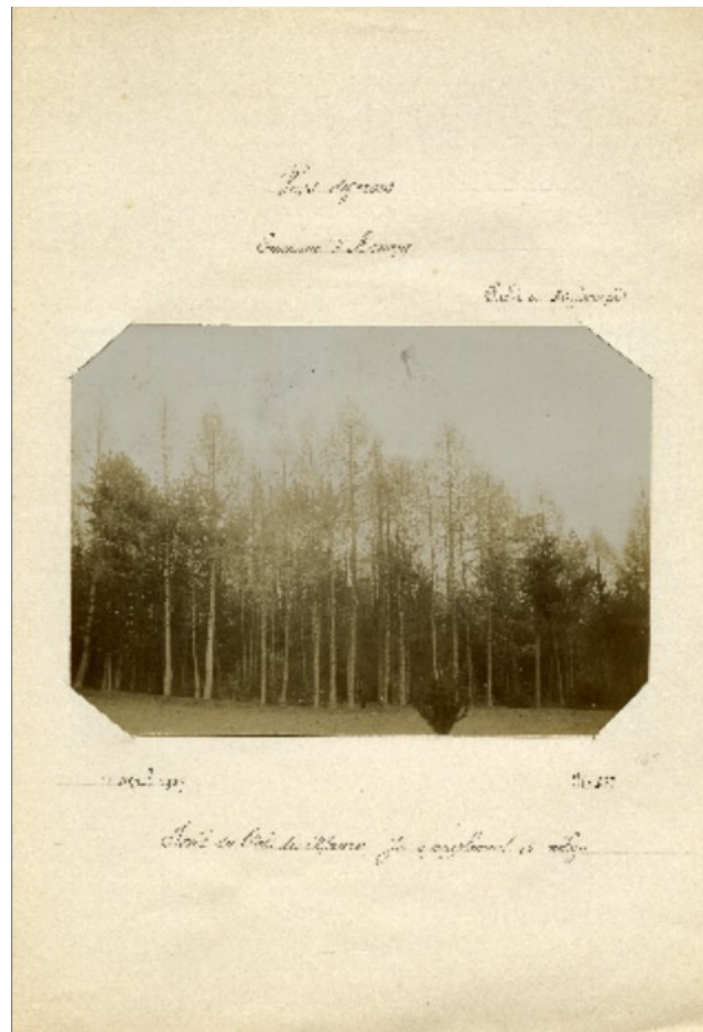
Forêt du Crêt du Maure. Jeune peuplement de mélèze, 1907. Issu du fonds 7 M 2316-3203 Inventaire de la photothèque du service Restauration des terrains de montagne (1886-1938)