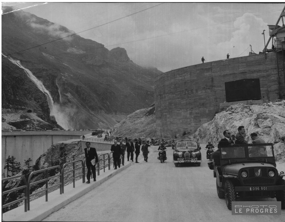
Barrage hydroélectrique de Tignes, 1951