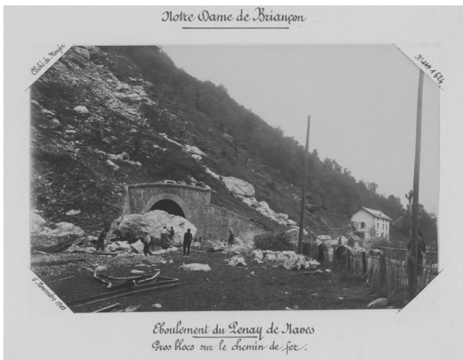
Gros blocs sur le chemin de fer, 5 novembre 1903