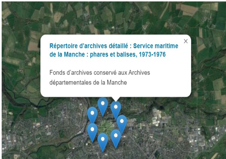
Géolocalisation des fonds d'archives concernant la Manche

https://ressources.histoire-environnement.org/Carte?filtre=ressources